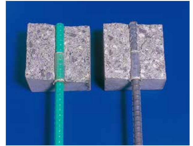
付着試験割裂後の供試体